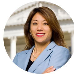
Fiona Ma, CPA Tesorera del Estado de California